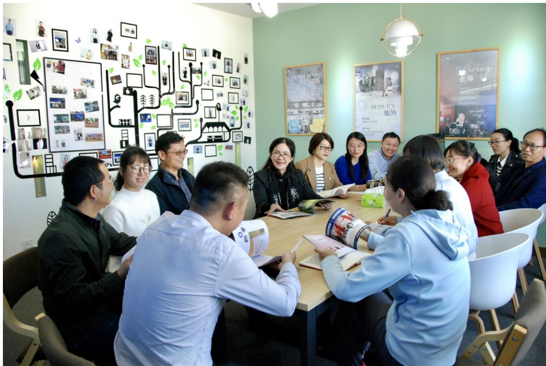
云南农业大学《微生物学》课程团队教研活动

创新成果应用于青年教师培养，辅导云南省、浙江省赛区教师获得全国高校教师教学创新大赛国赛二等奖 4 项，省级特等奖 6 项、一等奖 5 项、二等奖 5 项。同时，辐射带动多所高校，在教师培养、课程建设、专业建设取得显著效果。